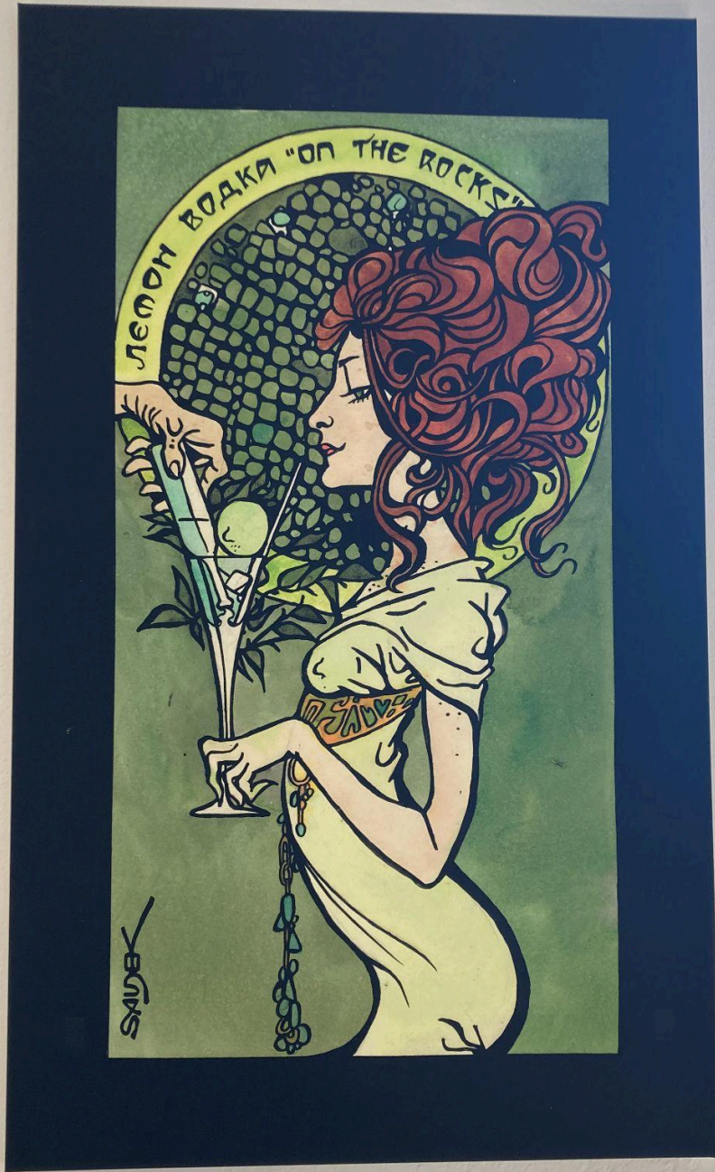
Сандер Лемон Водка Лемон Водка Матрица 211 Матрица 211 Матрица 211