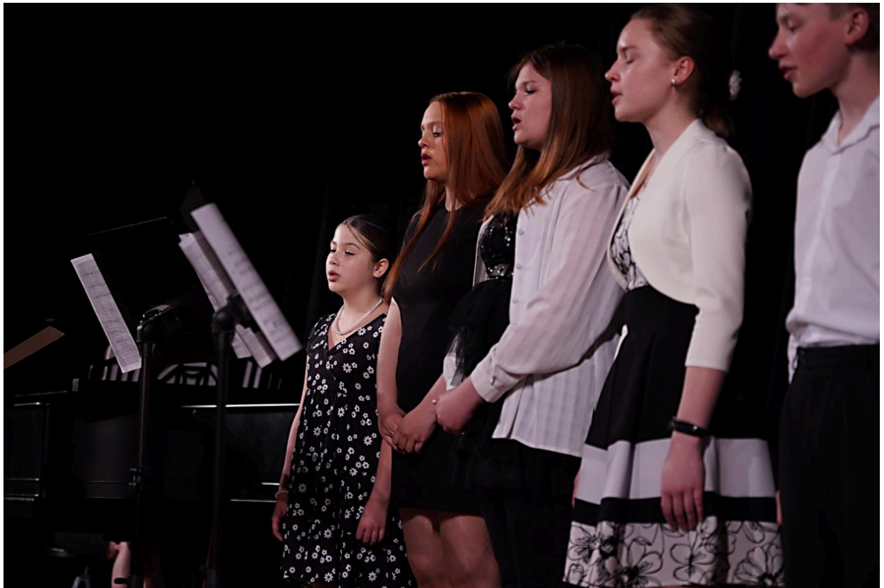
Koncert souborů a orchestru