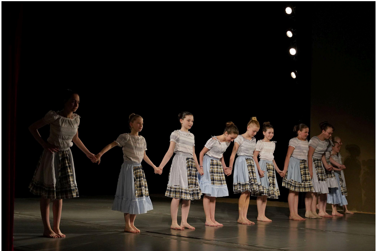
Tanec v rytmu roku 2023